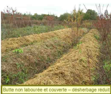
Butte non labourée et couverte – désherbage réduit

Une association « Imagine Un Colibri » Un projet pédagogique