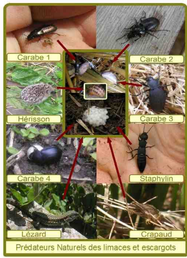
Prédateurs Naturels des limaces et escargots