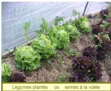
Légumes plantés ou semés à la volée