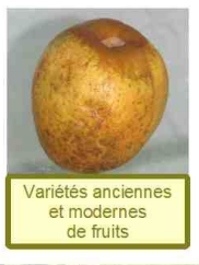
Variétés anciennes et modernes de fruits